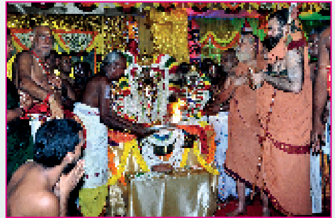
Viswaroopayathra – 30-7-2012